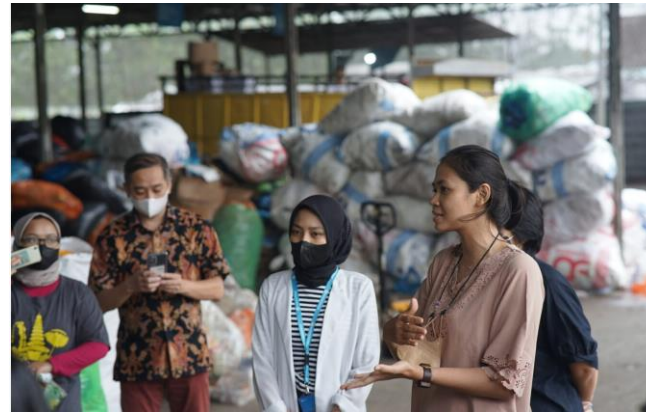
Edukasi Memilah Sampah