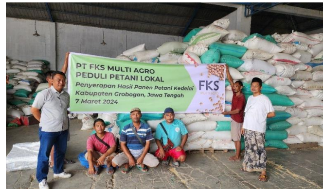
Penyerapan Kedelai Lokal