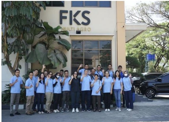
Bantuan dan Donasi