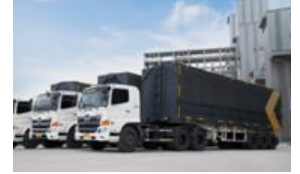
Surabaya & Cilegon