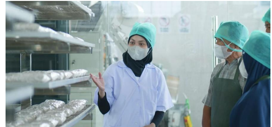
Pembinaan dan Pelatihan UMKM terkait produksi Tempe